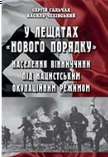
У лінійній формі. Мультимедіальний матеріал аналізує становище цивільного населення Вінницької області в період Другої світової війни