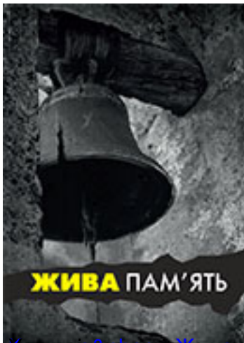
Учора і сьогодні. Життя в Україні в роки Великої Вітчизняної війни