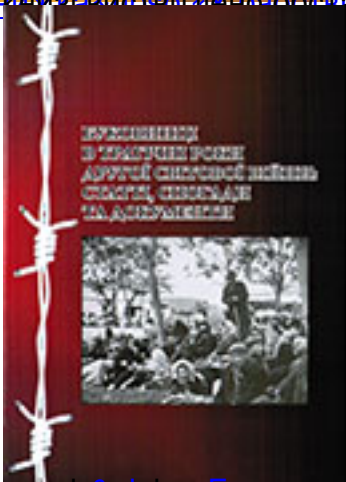
Учора і сьогодні. Життя в Україні в роки Великої Вітчизняної війни