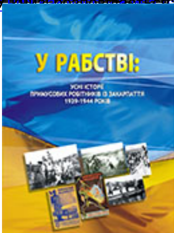
Учора і сьогодні. Життя в Україні в роки Великої Вітчизняної війни