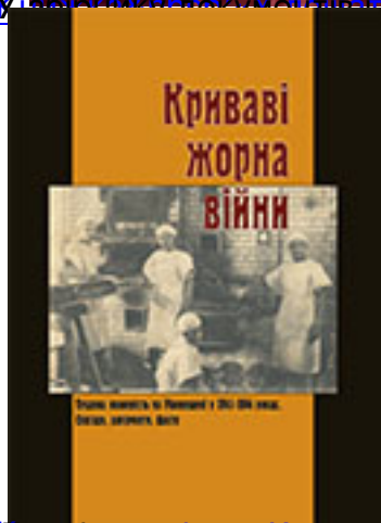
Дослідження системи примусової праці на Рівненщині, умов життя, роботи, спілкування простих українців в період Другої світової війни